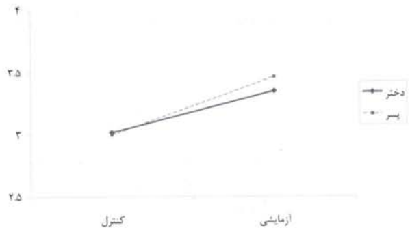
شکل ۱. اثر تعاملی گروه و جنس در مؤلفه ماهیت خداوند

معنادار به دست آمد. با آنکه میانگین هر دو جنس در گروه کنترل کمتر از گروه آزمایشی بود اما پسرها در گروه آزمایشی میانگین بالاتری نسبت به دختران به دست آوردند. نمودار این اثر تعاملی در شکل ۱ نشان داده شده است.